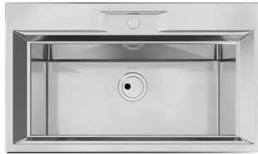
Spülbecken FL 2975 060